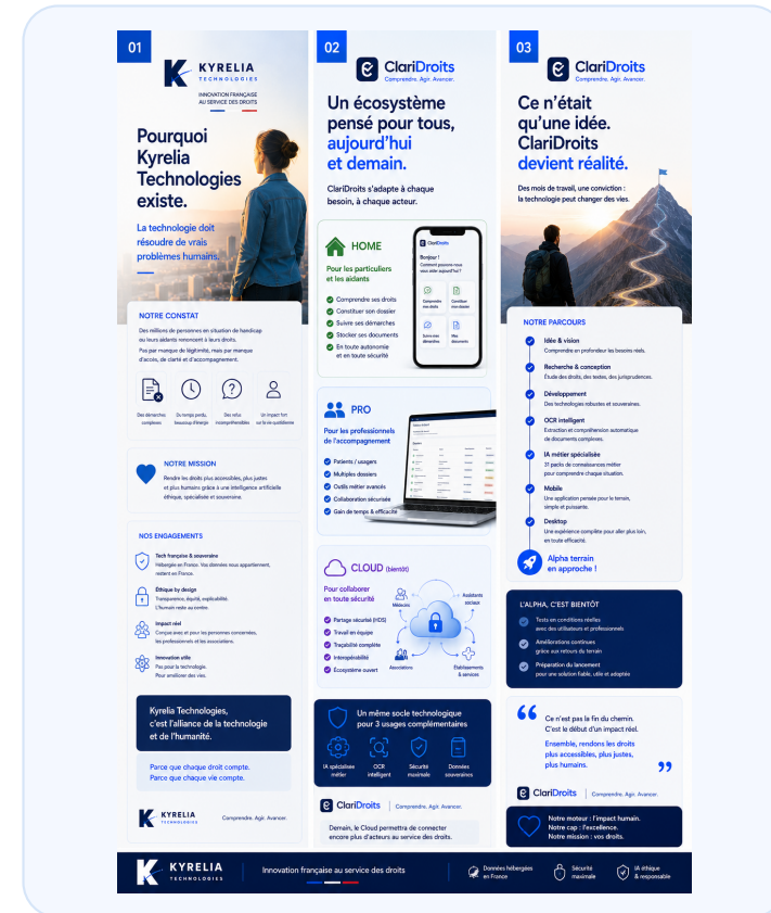
Visuel sélectionné : vision écosystème.